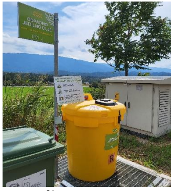
Naselje KAMNICA bližina Kobanska ulica 8