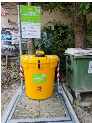
Naselje CELESTRINA bližina Celestrina 1