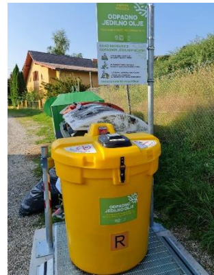
Naselje RAZVANJE bližina Krožna pot 12