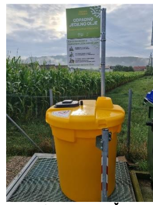
Naselje DOGOŠE bližina Gasilska ulica 17