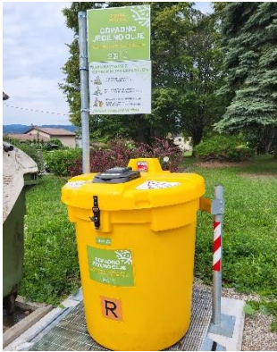
Naselje LIMBUŠ bližina Ulice Drine Gorišek 19