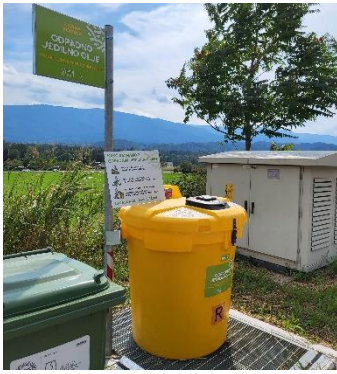
Naselje BRESTERNICA bližina Bresterniška ulica 219