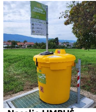
Naselje LIMBUŠ bližina Ob Blažovnici 56a