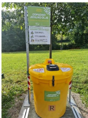
Naselje HRASTJE bližina Hrastje 17e