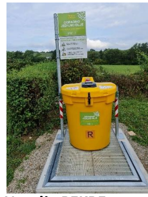
Naselje PEKRE bližina Bezjakova ulica 103