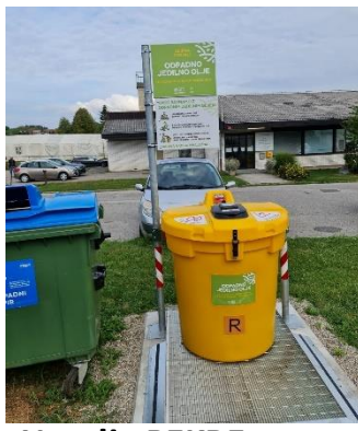
Naselje PEKRE bližina Bezjakova ulica 11