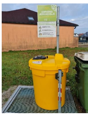
Naselje ZRKOVCI bližina Cesta ob lipi 2