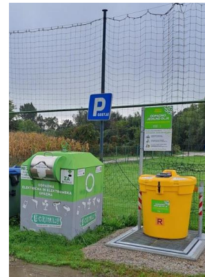
Naselje MALEČNIK bližina Malečnik 56 - pri igrišču